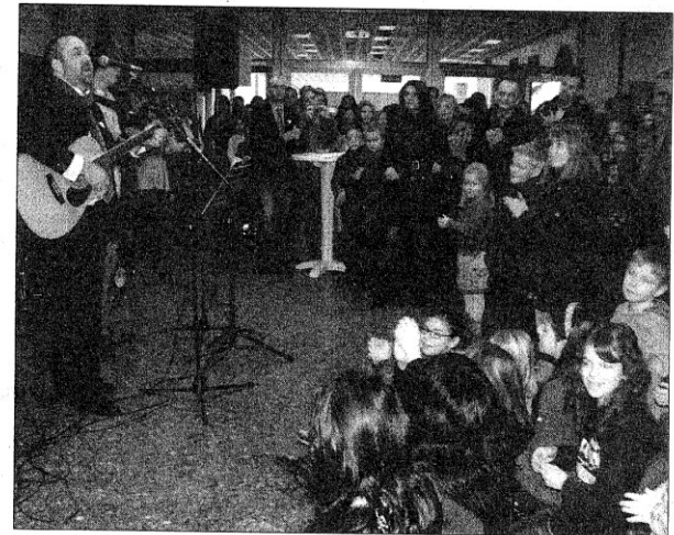
Die Schulband der IGS spielte zur Eröffnung des Tags der offenen Tür.