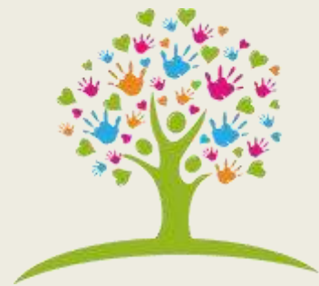
Kurswahlmöglichkeiten IGS Rheinzabern